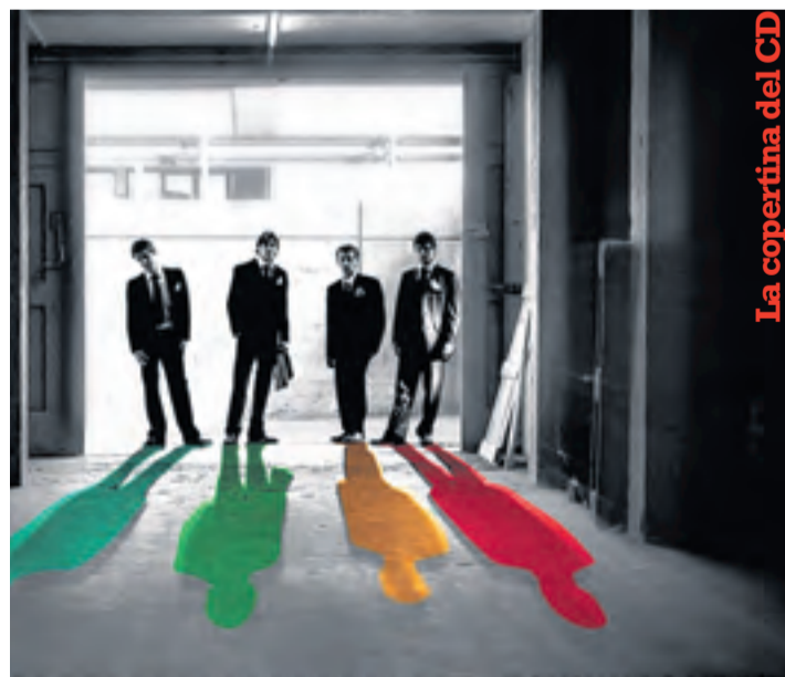
La copertina del CD